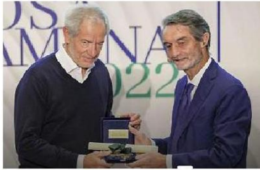
Il presidente Attilio Fontana con Guido Bertolaso

Premio Speciale alla memoria. Nasce a Desio il 15 ottobre 1922 e muore a Milano il 22 febbraio 2005. Dal 1964 al 1990 è professore di Introduzione alla Teologia all'Università Cattolica del Sacro Cuore.